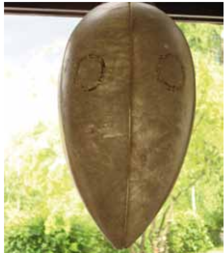
Lámppásuodji náhkis. Design Bölebyns Garveri.