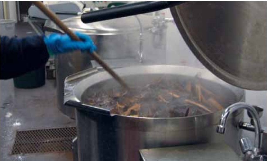
Osttut duoldamin vuosšanruittus.

Osten dáhpáhuvvá loika ostučázis, ii goittotge badjel +38 °C. Osten bistá vahku dahje juoba guokte. Náhkit luvvadvvojit álo ođđa ostučázis, buohkanassii moaddelogi geardde dan mielde, galle náhki leat. Náhki ostenvuohki ja –gráda vállejuvvojit sistti anu mielde. Jus sisti lea omd. gáffeseahkaide ja eará smávva dujiide, maida galgá dipma ja litna náhkki, sistti galgá ostašuvvat čađa, giksat. Čuovvovaš ráva leage čađa ostejuvvon sistti várás.