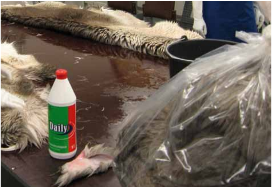
Navildeapmi. Duljiid bidjet seahkaid sisa loktima maŋŋa.

Navildeami áigge galgá čuovvut duolli temperatuvrra. Vaikko duolljeseahkka sáhtta leat stobus, de goittotge láhtteliekas lea dábálaččat menddo beaktiil. Duolli galggašii seailut čoaskkisin navildeami áigge. Dan sáhtta dárkkistit lovttedettiin