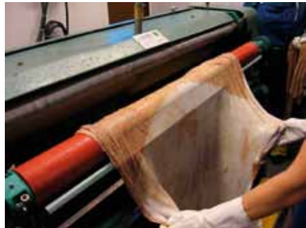
Nubbi bealli náhkis lea juo neskon ja náhkki lea jorgaluvvon nuppi beali neaskima várás.