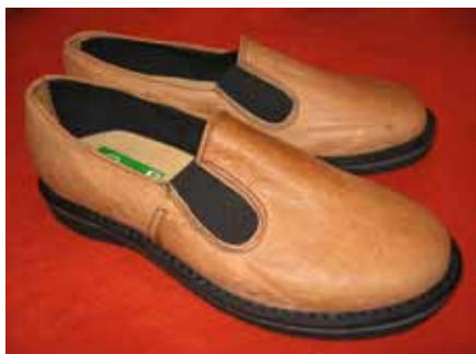
Sistegápmagat. Design Satu Maarit Natunen.

Sisteduojit leat árbevirolaččat sámeduo- jit. Sisti leat atnán biktasiid, gárvvuid, niestelávkkaid ja seailluhanseahkaid ávn- nasin. Ođđa buvttadanvugiid ánsun lea, ahte dál buvttadit sisttiid eambo go go- assige ovdal. Ávdnasiid lea álkit oažžut, mii addá vejolašvuodaid ovddidit sisti atnima maddái ođđa buktagiidda. Sisttis sáhtá duddjot maid beare dujiid seam- ma láhkai go eará náhkiinge. Duojit sáht- tet leat vaikkoba dihtorsáhpánvullošat, suffáolgožat ja lámppásuojit.