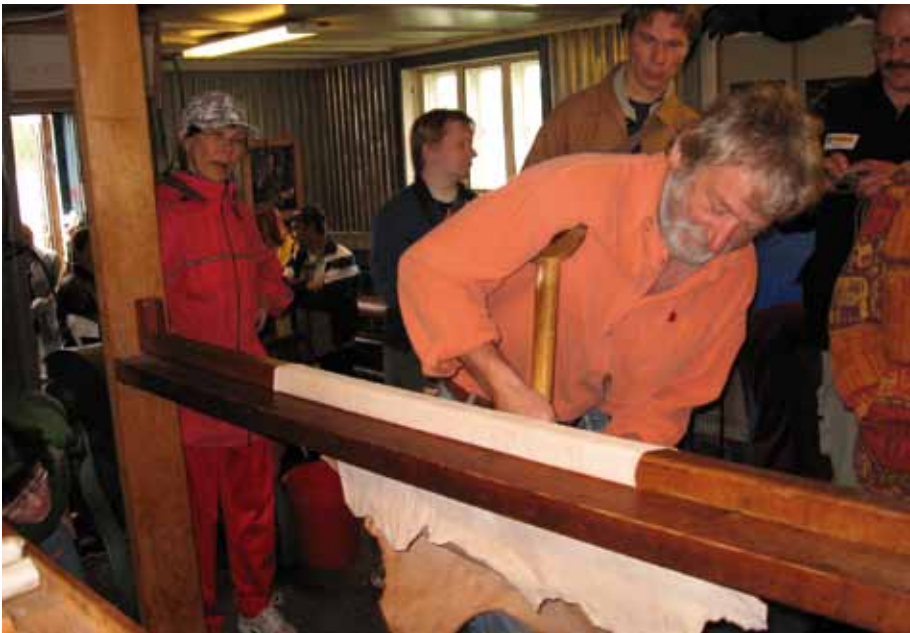
Goikaduvvon sitti dipmadeapmi Jokkmokks Naturskinn-fitnodagas.

Náhkkeindustriijas atnet mánggaid iešguđetlágan mášiinnaid náhkiid fanahallamii. Doaivunjárgga náhkkebjájis eai leat vel dákkár mášiinnat, nuba náhkiid ferte fanahallat gieđaiguin. Sitti sáhhtá fanahallat gieđaiguin, jiehkkuin, faskaniin dahje dipmadeami ja fanaheami várás duddjojuvvon nađđaruvddiin dahjege spierkkuin, man dearri ii leat nu bastil. Maiddái ruvvenmuorra lea anus fanahaladettiin.